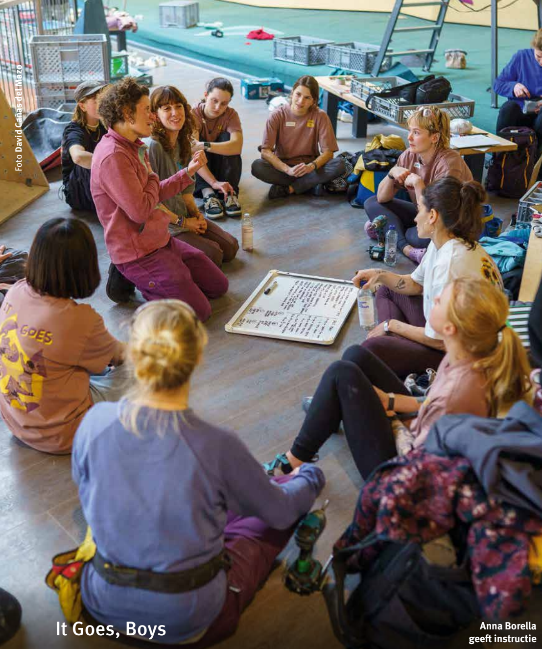
It Goes, Boys